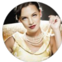
Charlotte Style & Fashion