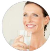
Cécile Heath & Beauty